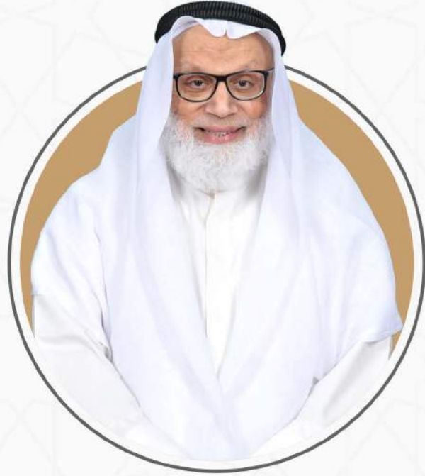
المشرف العام للمركز الوقفي لأجيال القرآن الكريم